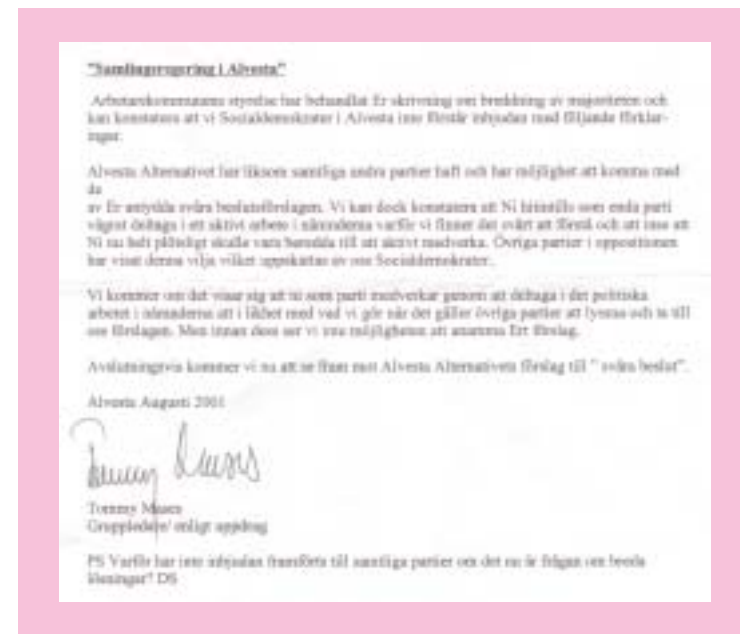
Det kom ett brev som långt ifrån var välvilligt att anta vårt erbjudande om att hjälpa till med att lösa kommunens ekonomiska problem.

Socialdemokraternas sursvarsbrev hävdar också att Alvesta Alternativet inte deltar i nämnsarbetet. Vad man menar med detta är obegripligt. Vi deltar med liv och lust i detta arbete, men om socialdemokraterna menar att vi i varje läge ska ställa upp på den linje (s) valt, kan man framställa det på deras sätt.