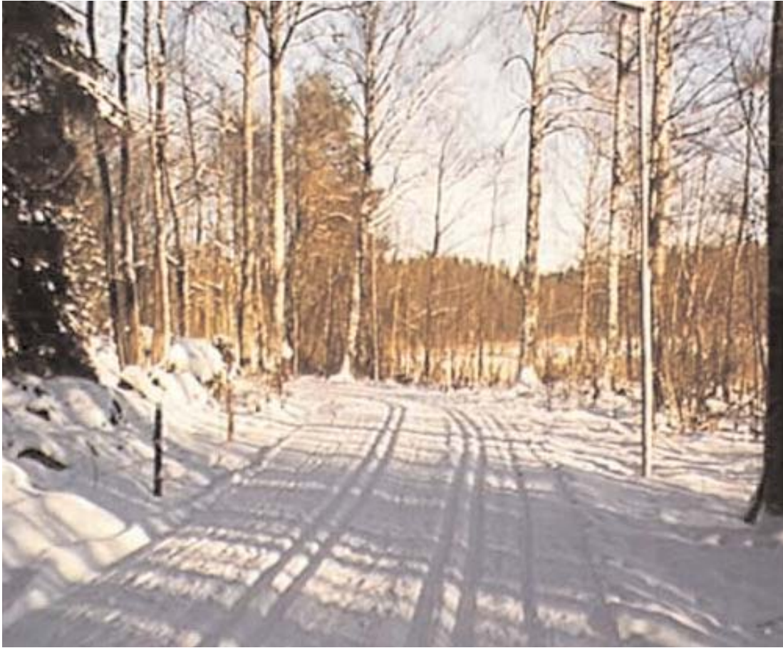
Snön lyste vit under ett par fina vinterveckor. Nederbörden kom lagom till jul och alla lovlediga fick verkligen chansen att idka vintersport. Längdåkningsspåren låg inbjudande i Spånen och Hanaslövsområdena.

Snön kom för första gången på åtskilliga år lägligt till alla skollediga ungdomars enorma glädje. Äntligen kunde man få prova både julklappsskidorna och pulkan.