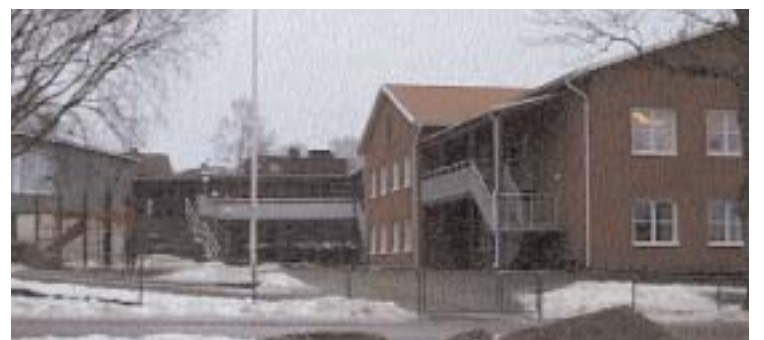
Prästängsskolan är allt för trångbodd för att kunna ta emot all den verksamhet som var tänkt. Att begränsa skolan till F-6 alternativt F-7 är en möjlighet.

I samband med dessa förändringar vill vi också pröva möjligheten att låta de självstyrande grupperna på Prästängsskolan ta helhetsansvaret för sin verksamhet. Dagens ledning vid skolan kunde på detta sätt sparas in. Vi skulle då på sikt kunna återgå till den tidigare organisationen med fyra rektorsområden i kommunen. Stora administrativa besparingar skulle uppnås utan att själva verksamheten blev lidande.