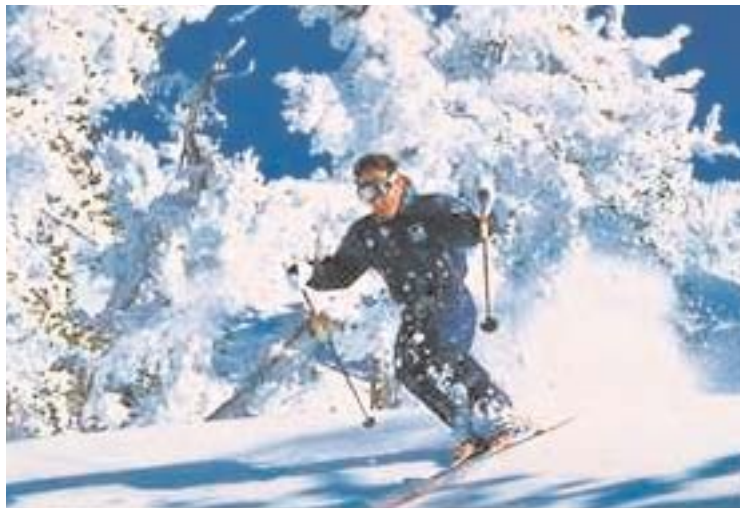
Utförsåkarna fick bara 1,5 dagar på sig att njuta av det härliga vintervädret i Hanaslövsbacken under jul- och nyårshelgerna.

Medan längdåkarna hade välpreparerade spår för både klassisk som skating färdiga dagen före julafton, så låg backarna opreparerade också efter julhelgen.