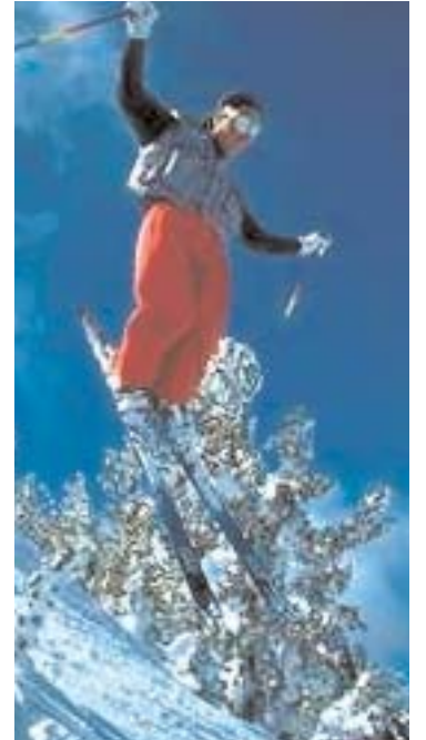
Skidåkning av den här sorten blev det inte mycket av i Hanaslöv denna snörika jul och nyår.

Anledningen till att liftarna inte kom igång var flera olika faktorer. Främst får tydligen Alvesta kommun tar på sig kritiken efter att sparkraven tvingat fram ett nytt avtal med förening-