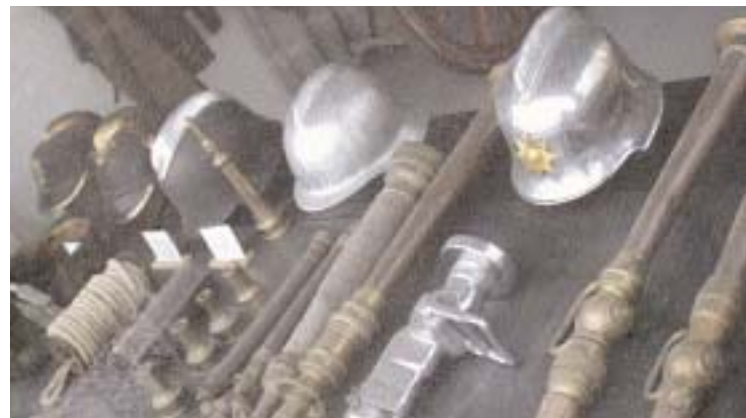
Det kan bli som vi befarar att endast museum återstår av Mohedas räddningssstyrka.

Förutsättningarna var från början att en sammanslagning av räddningstjänsterna i Alvesta och Växjö skulle innebära besparingar. Idag ser vi att resultatet för Alvestas del inte blev det förväntade. Redan i första budgeten ökar kommunens kostnader med några hundra tusen kronor och när Växjös brandstation är utbyggd ökar kostnaderna med ytterligare cirka 400000 kronor. Vår ingångskostnad ligger också 25 % högre än Växjös per kommuninvånare. Den skillnaden får vi behålla också framgent eftersom förändringarna i