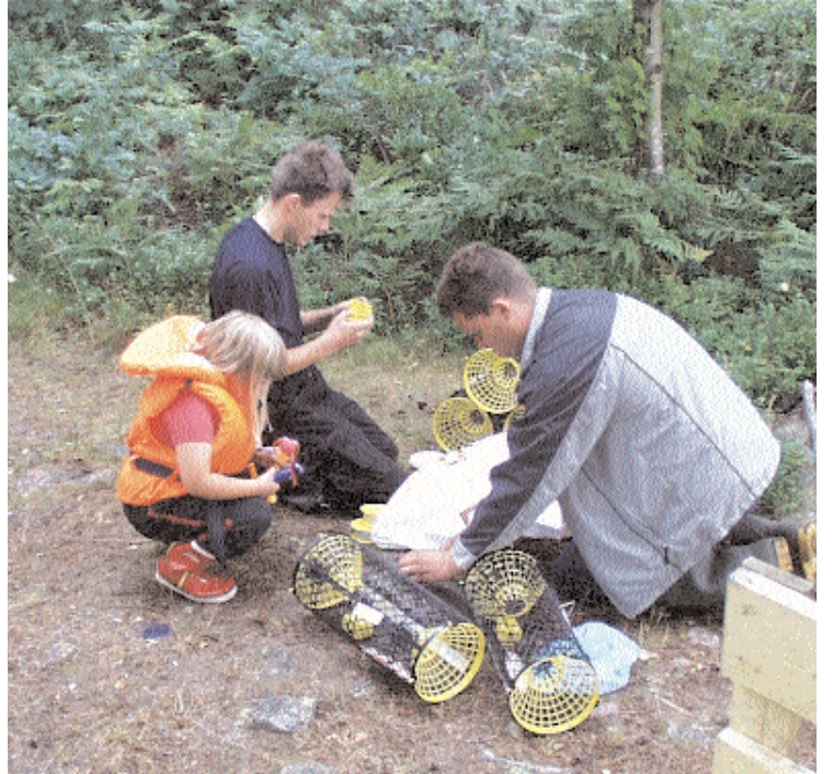
Gammal som ung. Intresset för kräftfisket hade inga begränsningar i åldershänseende. Här ett av många gäng som var i gång under fiskekvällarna.

Det är inte utan att många redan nu ser fram emot fortsättningen. Gemenskapen kring lägerbålen under fiskekvällarna gav mersmak. Visserligen hade arrangörerna en osedvanlig tur