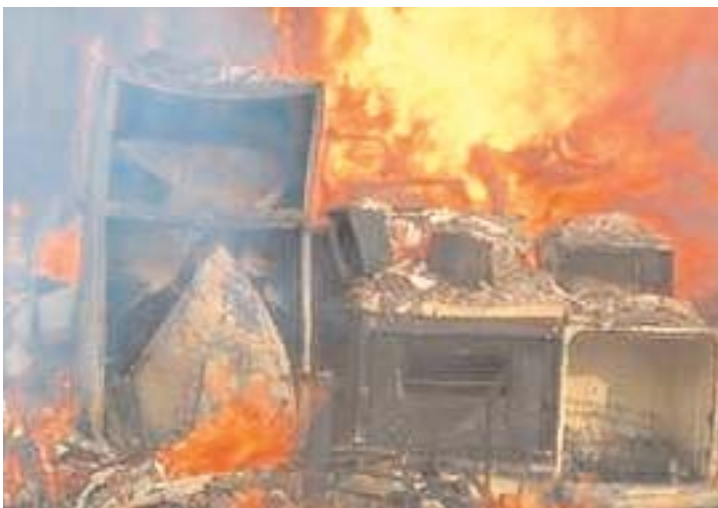
Det blev Värends räddningstjänstförbund som står för den fortsatta räddningstjänsten i Alvesta kommun.

Det blev tvärtemot vad personalen ville. Alvesta kommuns fullmäktige beslöt före jul att gå samman med Växjö i ett nytt kommunalförbund för att sköta den gemensamma räddningstjänsten.