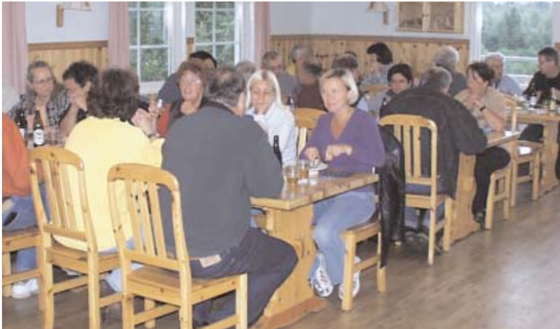
Alvesta Alternativet har firat sitt 10-årsjubileum genom en sammankomst i Alvesta SOK:s klubbstuga i Hanaslöv. Ett fyrtiotal medlemmar hade mött upp till en eftermiddag i leken och matens tecken. En femkamp och tipsrunda ingick i aktiviteterna, men där samvaron runt matbordet ändå utgjorde huvudinslaget. Här ses en del av deltagarna samlade vid matborden i Hanaslövsgården.