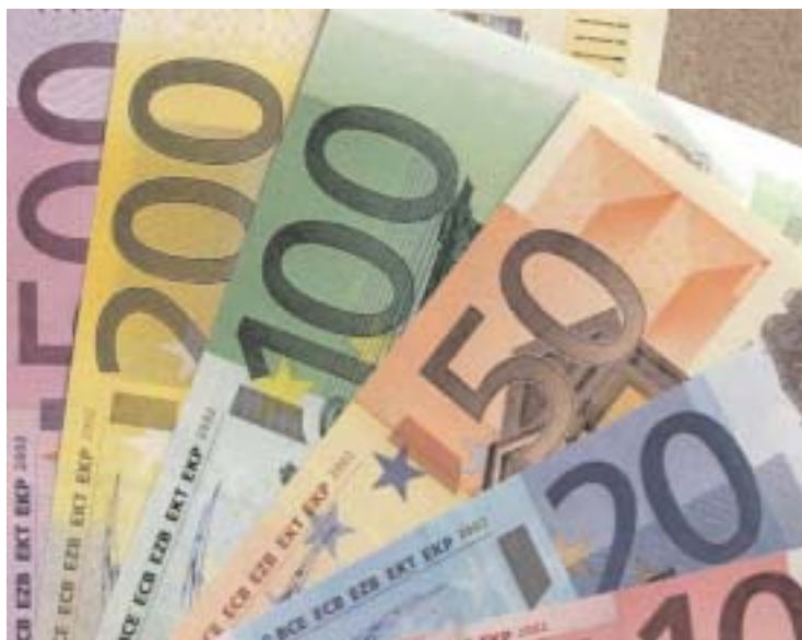
Det är nyttigt att avvakta en anslutning till EMU. Inte minst med tanke på de faktorer som kan påverka införandet av gemensam valuta. Nu får vi tid på oss att studera hur resultatet blir innan vi själva tar ställning.

En sak är dock säker. Någon dyr nota för att vi står utanför EMU har vi än så länge sluppit att betala. Däremot måste man ställa frågan varför Sverige, som har det så erbarmligt enligt vissa, är en av få nettobidragsgivare till EU. De miljarder som vi årligen sänder till Bryssel har vi faktiskt ännu så länge inte sett något resultat av. De hade faktiskt gjort betydligt mer nytta här hemma i skola och åldringsvård än under kristallkronorna i Bryssel.